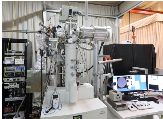
図 1. 開発した時間分解透過電子顕微鏡。